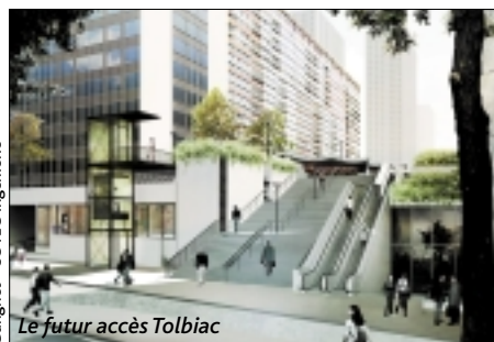
Cangniet - SOTEC Ingénierie