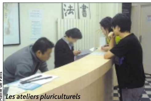
Mairie de Paris

Contact : Mehdi SERDIDI – Tél. : 01 45 70 75 32