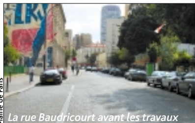
Mairie de Paris