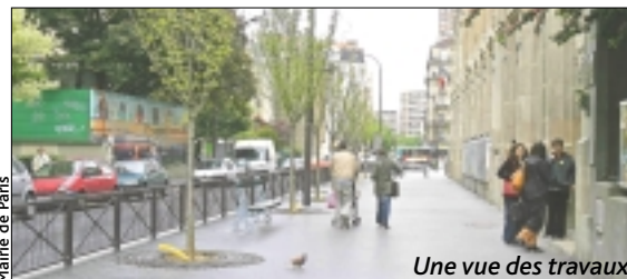
Mairie de Paris