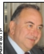
Maire du 13 e

Parce que nous souhaitons que les Olympiades soient à l'image de Paris, plus solidaires, plus sociales, plus dynamiques, nous continuerons, à vos côtés, à nous impliquer dans l'évolution du quartier.