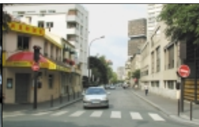
La rue Baudricourt avant les travaux