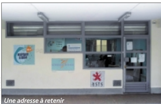
Mairie de Paris