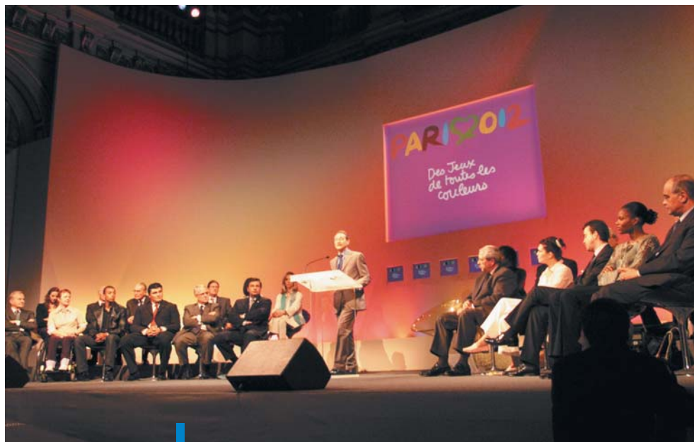
Bertrand Delanoë annonce à l'Hôtel-de-Ville la candidature de Paris pour l'organisation des jeux Olympiques et Paralympiques de 2012.

Paris est candidat pour l'organisation des jeux Olympiques et Paralympiques de 2012. Un véritable challenge pour la ville, la région et la France entière.