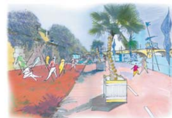
Tai-chi, Beach Volley et pétanque réservés aux seniors, de 10 h à midi.

Alors, cet été, pour trouver la plage à Paris, rendez-vous sur les quais ! ■