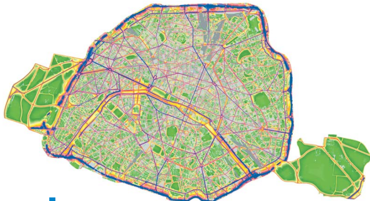
Carte du bruit routier moyen à Paris, de jour. Mairie de Paris - Service Technique de l'Ecologie Urbaine

La carte du bruit routier à Paris est disponible sur paris.fr