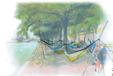
Des hamacs pour la sieste.