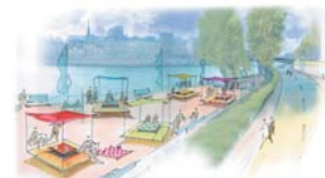
Les deux espaces pique-nique : des radeaux qui favorisent la convivialité.