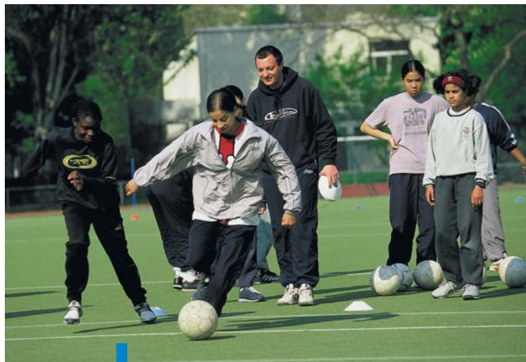
Les stages de sport sont encadrés par des moniteurs professionnels.