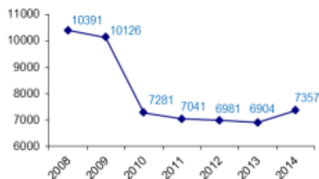
Graphique 2 : Fréquentation de la salle de lecture depuis 2008